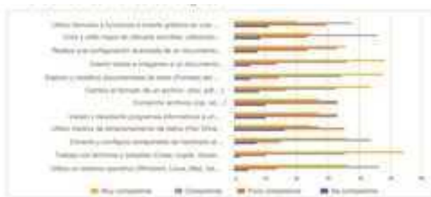
Figura 2. Dimensión conocimientos tecnológicos

Tal y como se aprecia en la figura 2, esta dimensión agrupa 12 ítems, de los cuales se destaca el uso básico del computador a nivel de hardware