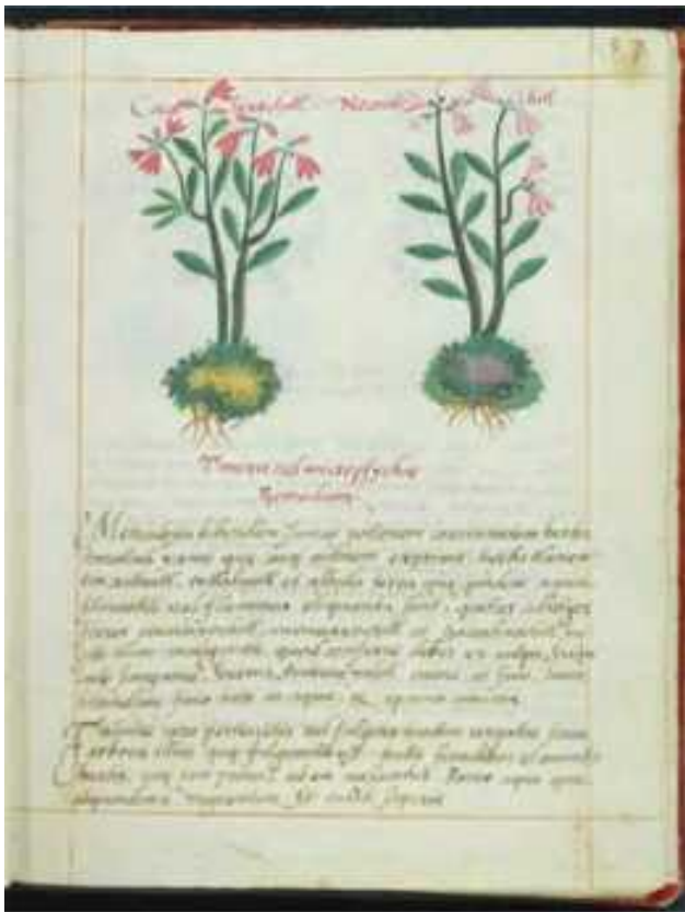
Figura 14 Códice Badiano, foja 53 9

recibían las parteras, la denuncia sirvió para debilitar su prestigio ante la comunidad de la Villa de Campeche. Como es de suponer, quien salió beneficiado de esa desacreditación, fue, precisamente, Don Felipe de León, el doctor en medicina.